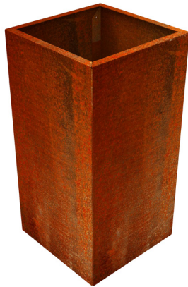
Haut pot corten